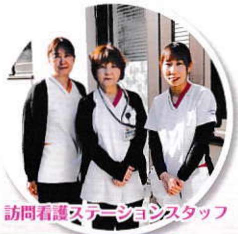
訪問看護ステーションスタッフ